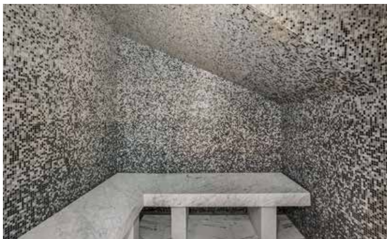
Même sous combles, vous pouvez installer un hammam, comme ici dans cette réalisation avec mosaïque blanche et noire et banc en marbre. Chalet Tapia www.cimalpes.ski/fr/location-val-d-isere/appartement-tapia-1

Pour se souvenir de la différence avec le sauna H = Humide = Hammam = Chaleur humide S = Sèche = Sauna = Chaleur sèche