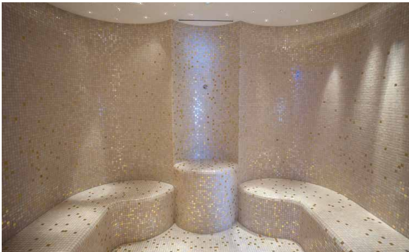
Hammam résidentiel en mosaïque, ciel étoilé. L'apport de mosaïque dorée offre de très beaux éclats de lumière et une ambiance ultra raffinée. Photo réalisée à Ikos Aria, en Grèce. www.ikosresorts.com