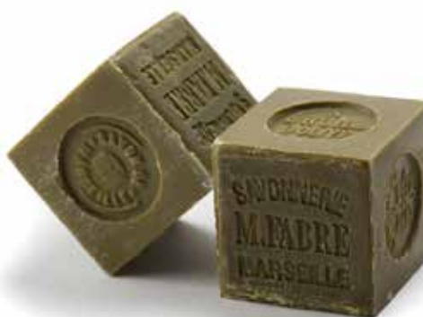
Idéal pour la famille et tous les types de peau, surtout sèches, ce savon à l'huile d'olive est 100 % naturel et biodégradable. A partir de 3,40 €. Marius Fabre. www.marius-fabre.com

Attention aux moisissures et à l'humidité. Tout doit être parfaitement étanche et suffisamment aéré... Voilà pourquoi, l'intervention d'un professionnel est fortement recommandée.