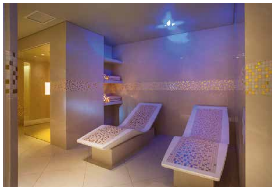
Agréable, les aménagements, comme ici ces bancs de gommage carrelés pour la détente et/l'exfoliation, participent au confort de votre hammam. Hammam, Relaxation Area Spa, Ikos www.ikosresorts.com

Autre possibilité, très « gain de place » : concevoir sa douche comme un hammam. On met en marche la vapeur uniquement si on veut faire un hammam, sinon, on utilise sa douche XXL normalement.