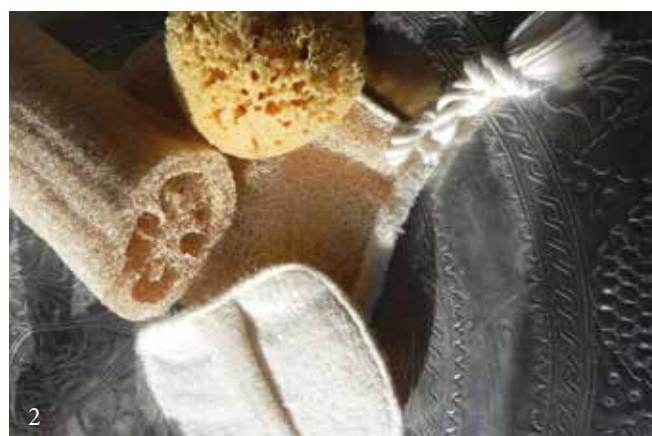
1 - Optez pour des produits naturels, dont l'effet est décuplé par la chaleur, comme ici ces pains de savons naturel à l'huile d'olive, 110g, 5,80 €. www.senteurs-et-couleurs-du-souk.fr 2 - Assortiment de gant et éponge en loofah, des fibres 100% naturelles, issues d'un fruit séché. ils offrent un peeling plus doux notamment sur le visage. Loofah d'Egypte à partir de 3 €, Eponge de mer 18 €. Karawan. www.karawan.fr